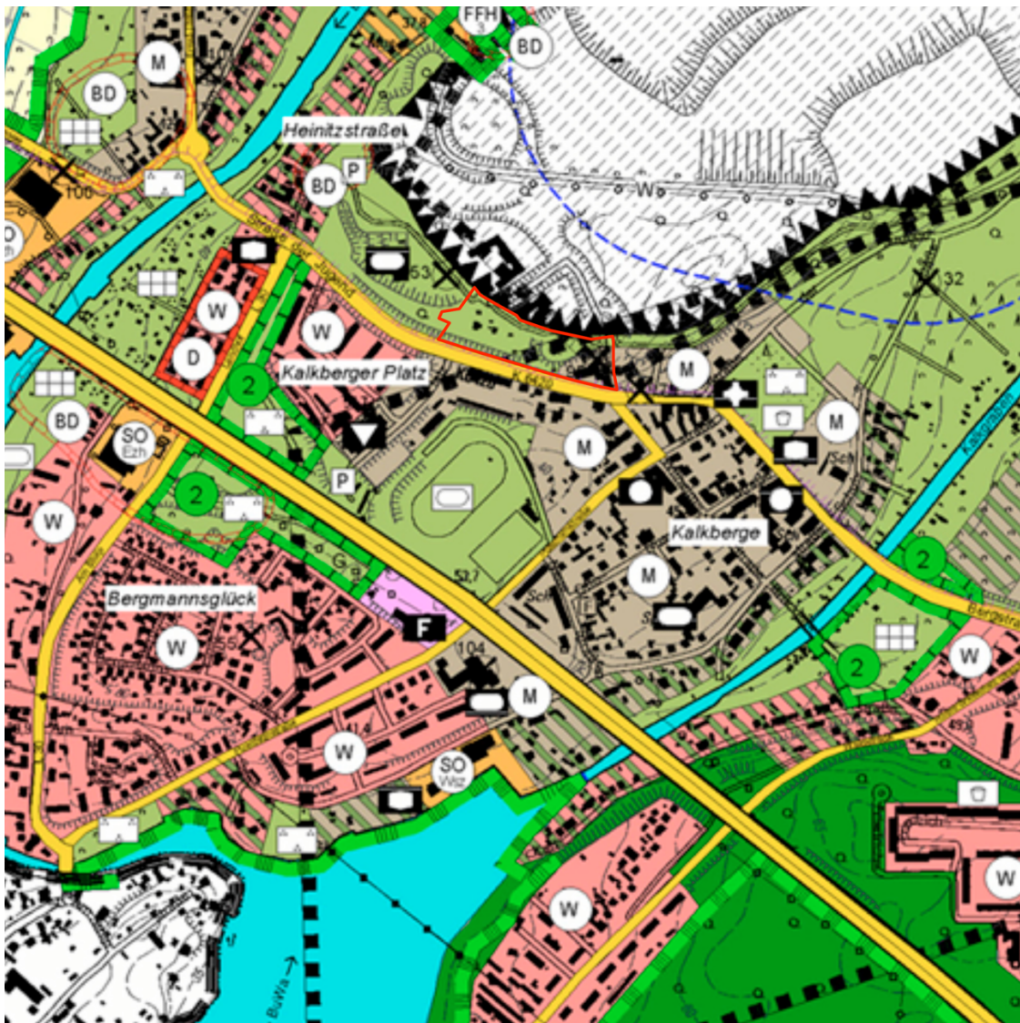
Abb. 2: Ausschnitt aus dem geltenden FNP der Gemeinde Rüdersdorf bei Berlin, in der Fassung vom 25. Oktober 2010 mit dem räumlichen Geltungsbereich der 4. Änderung (rot), ohne Maßstab, genordet