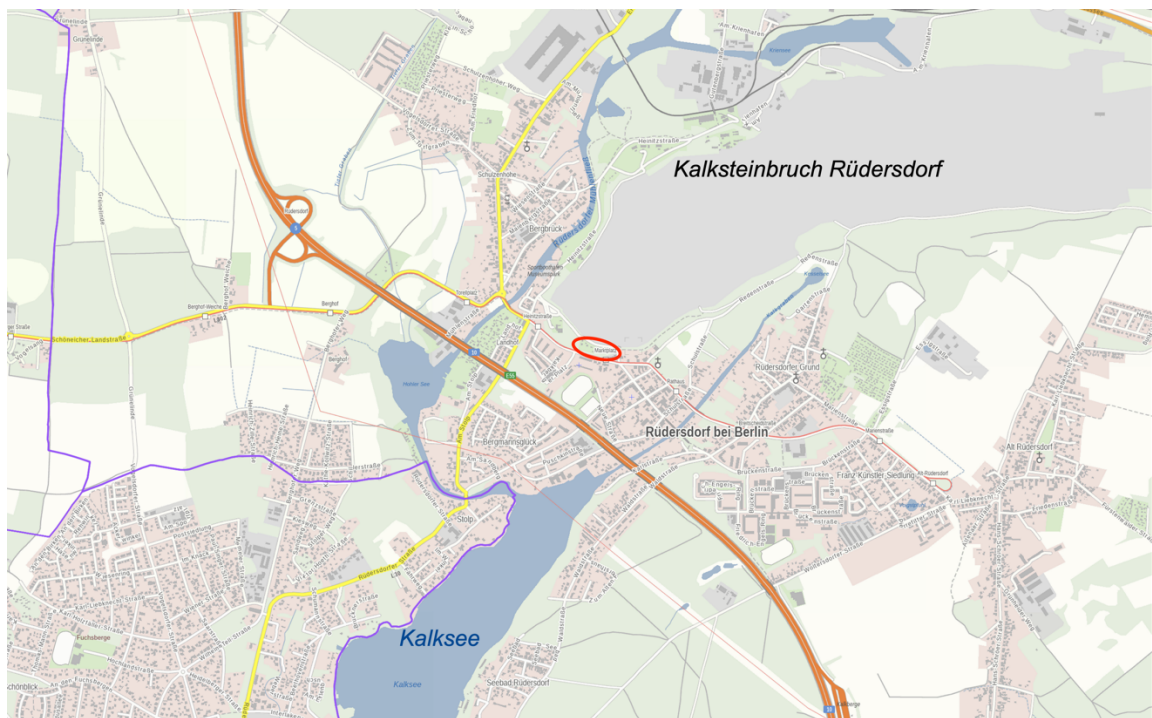
Abb. 1: Lage des Plangebietes im Gemeindegebiet, o. M.

Der räumliche Geltungsbereich der 4. FNP-Änderung umfasst die Flächen des räumlichen Geltungsbereiches vom Bebauungsplan Nr. 33 „Verbrauchermarkt Straße der Jugend“, die im Bebauungsplan als sonstiges Sondergebiet festgesetzt sind. Für die Verkehrsfläche der Straße der Jugend besteht im Rahmen des FNPs kein Planungsbedarf.