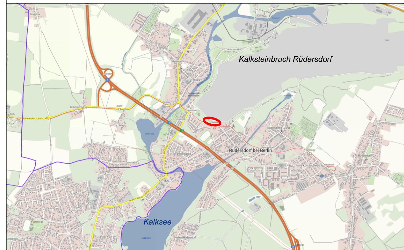
Maßstab 1 : 25.000, Plangrundlage: Brandenburg Viewer, 2024