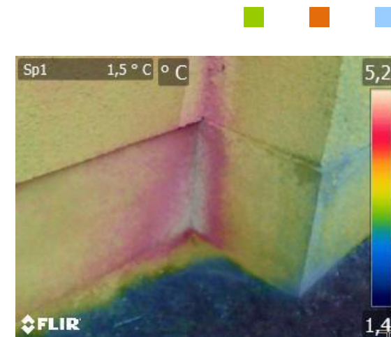
An dieser Ecke dringt nicht nur Wärme nach draußen, es kann auch Feuchtigkeit ins Mauerwerk eindringen. Hier droht Schimmel.