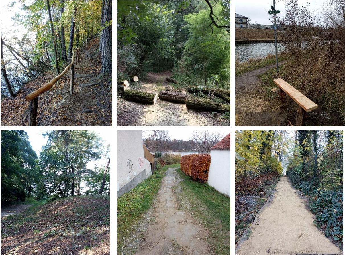
Aus dem Arbeitsalltag des Wanderwegewarts