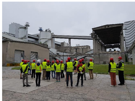
Studierendengruppe im Rathaus und zu Besuch bei CEMEX