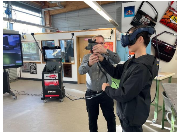
Bunte Meile in Hennickendorf

Ebenfalls zum zweiten Mal fand am 12. Oktober 2024 die Bunte Meile in der Gemeinde statt, nach dem Auftakt 2022 in Herzfelde dieses Mal in den Räumlichkeiten der Berufsbildungsstätte der Handwerkskammer in Hennickendorf. 40 Unternehmen und Einrichtungen aus Rüdersdorf bei Berlin und umliegenden Gemeinden haben sich dort mit ihren Angeboten präsentiert, insbesondere das Handwerk konnte in den Ausbildungswerkstätten viele spannende Einblicke geben. Im Gegensatz zur ersten Bunten Meile wurden die Aspekte Job- und Ausbildungssuche sowie Weiterbildung in den Mittelpunkt gestellt, wodurch die Veranstaltung mehr Messecharakter bekommt und weniger Familienfest war. Aufgrund des positiven Feedbacks der Aussteller gibt es aktuell Überlegungen, die Bunte Meile jährlich stattfinden zu lassen. Hierzu sind noch Abstimmungen mit den beteiligten Partnern notwendig. Das heißt allerdings auch, dass vom zweijährlichen Wechsel von Bunte Meile und Unternehmensempfang abgewichen wird. Da der Gewerbeverein Rüdersdorf das Format des Unternehmensempfangs aber als jährlichen Neujahrsempfang erfolgreich weiterführt, kann die Anzahl der Veranstaltungen für Unternehmen so sogar erhöht werden bei geringeren Kosten für die Verwaltung.