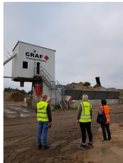
Unternehmensbesuche der Bürgermeisterin

Daneben gibt es einen regelmäßigen Austausch mit verschiedenen Institutionen, insbesondere der Industrie- und Handelskammer Ostbrandenburg, der Handwerkskammer Frankfurt (Oder) Region Ostbrandenburg, der Agentur für Arbeit, der Wirtschaftsförderung Land Brandenburg GmbH und dem Gewerbeverein Rüdersdorf.