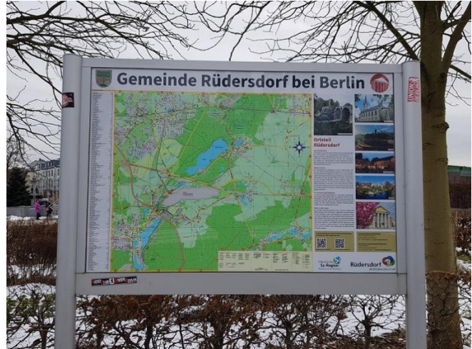
Erneuerung Druck historischer Tafeln in Hennickendorf; Erneuerung touristischer Übersichtstafeln in allen Ortsteilen