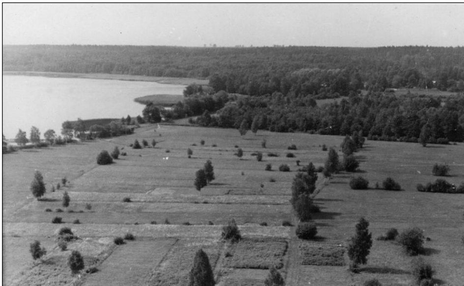
Blick über die Stienitzseewiesen zum Norufer des Großen Stienitzsees, Foto von 1954 vermutlich vom Wachtelberg aufgenommen

Basiphile Pfeifengraswiesen und die Wiesen der kalkreichen Niedermoore sind nach der Flora-Fauna-Habitat-Richtlinie der EU europaweit geschützt, und Brandenburg ist in der Pflicht, diese zu erhalten.